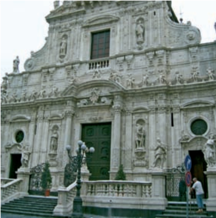
◀ Die barocke Chiesa San Sebastiano von Acireale