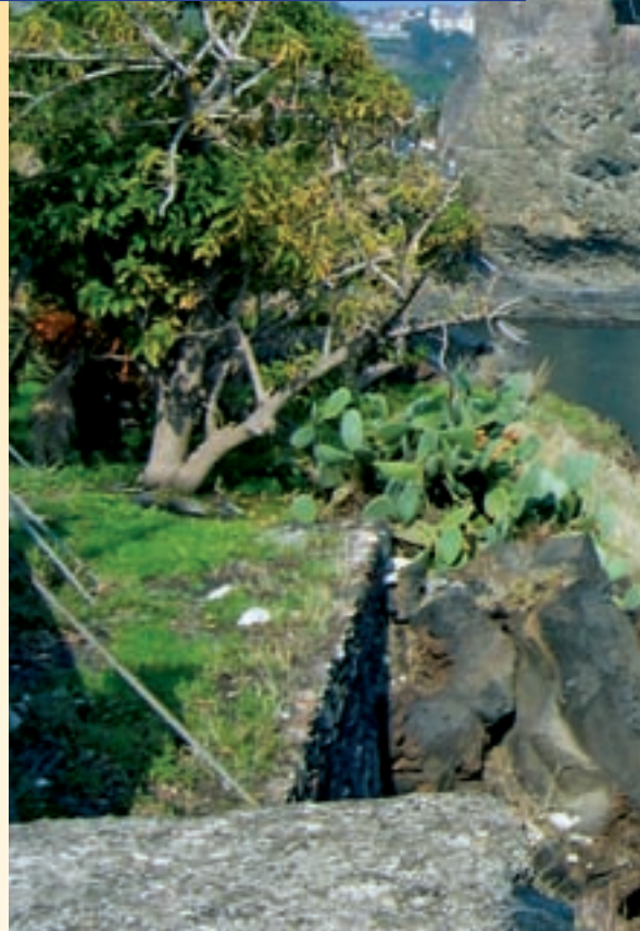
003ws Abb.: gg