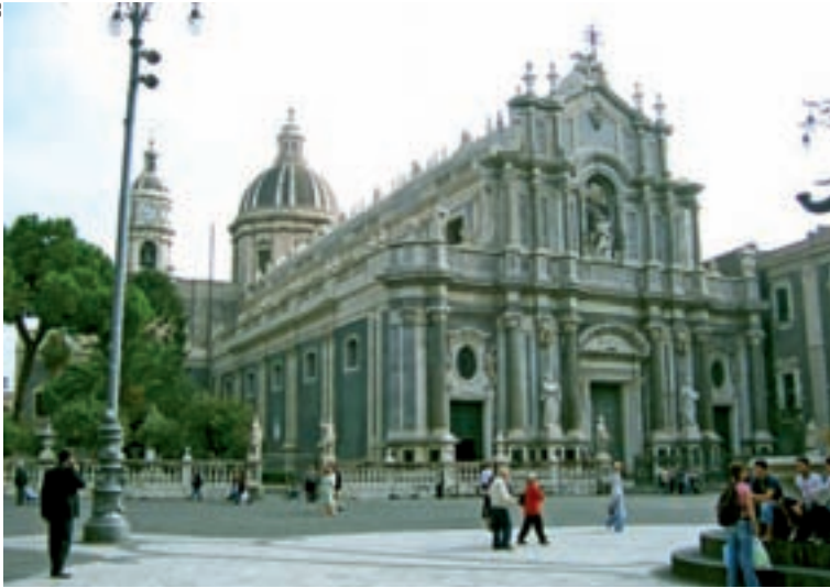
◀ Die barocke Kathedrale von Catania

Auf der Nordseite der Piazza steht das Rathaus , dessen barocke Fassade von Vaccarini , demselben Baumeister, der auch die Fassade der Kathedrale erschaffen hat, stammt. Gegenüber dem Rathaus gelangt man durch die Porta Uzeda zu einem lebhaften Fisch- und Lebensmittelmarkt. Lautstark werden vormittags Fisch, Obst, Gemüse und sonstige Lebensmittel angeboten. Gerüche, Düfte, Geschrei, Gedrängel: Hier kann das pralle sizilianische Leben genossen werden.