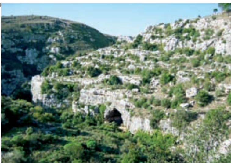
◀ Die Nekropolen von Pantalica