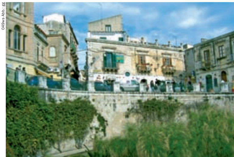
◀ Arethusa-Quelle mit Papyruspflanzen

Großer Campingplatz, nicht direkt am Meer. Von hier besteht die Möglichkeit, Siracusa mit öffentlichen Verkehrsmitteln zu erkunden. Lage/Anfahrt: Im Ferienort Fontane Bianche. Von der SS114 nach Fontane Bianche abbiegen, ausgeschildert am südlichen Ortsrand; Platzanzahl: 200; Untergrund: Wiese, Sand; Ver-/Entsorgung: Strom, Trinkwasser, Abwasser, Chemie-WC; Sicherheit: umzäunt, beleuchtet, bewacht; Geöffnet: 1. Mai bis 15. Oktober; Kontakt: 96100 Fontane Bianche, Viale dei Lidi 476, Tel. +39 0931790333, campingfontanebianchi@virgilio.it.