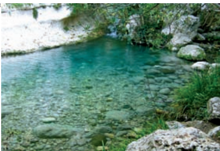
◀ Ein klares Becken lädt zu einer Badepause ein

In einer großartigen Kalkfelsenlandschaft liegt Pantalica , die größte Nekropole Europas. Eingehauen in die Felsen finden sich ca. 5000 Felsengräber , Hunderte Grotten und eine Höhlenkirche. Diese Totenstadt stammt aus der Zivilisation der Sikuler (12.– 7. Jh. v. Chr.). Da die Wohnhäuser aus Holz gebaut waren, sind von ihnen heute keine Spuren mehr zu entdecken. Vom Königspalast (Anaktorion) , dem einzigen aus Stein gebauten Gebäude, kann man noch die Mauern erkennen. Die karge Hochebene und die Schluchten des Flusses Anapo mit seinen natürlichen klaren Wasserbecken muss man unbedingt zu Fuß erwandern.