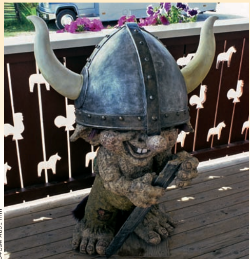
045sw Abb.: mm

In zahlreichen schwedischen Büchern wird von Trollen berichtet, die meistens in irgendeiner Art Schaden bringen. Heute findet man Trolle hauptsächlich in Souvenirgeschäften in allen möglichen Arten, sei es als geschnitzte Holzfigur, als