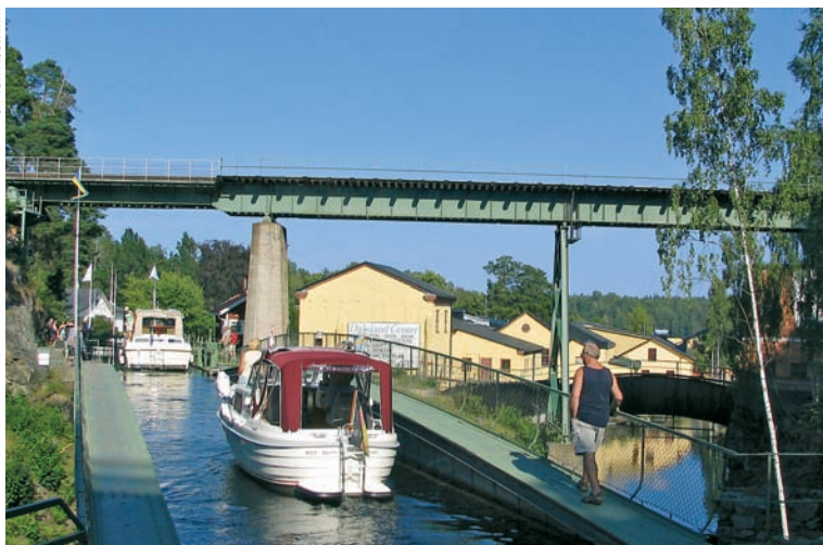
◀ Schleuse am Dalslandkanal

den. Über dieser Wasserbrücke verläuft eine Eisenbahnbrücke. Darüber wiederum hat man von einer Straßenbrücke eine schöne Aussicht auf dieses merkwürdig verzweigte System von Brücken und Schleusen, das immer wieder Besucher anlockt. Das angeschlossene Kanalmuseum in einem ehemaligen Bürogebäude zeigt, wie sich in Dalsland das Leben der Einheimischen vor und nach dem Bau des Kanals veränderte. An der Schleuse sieht man auch die Anlegestelle eines Ausflugsschiffes. Die „ M/S Storholmen “ legt in der Sommerzeit dreimal wöchentlich in Håverud ab, um nach fast fünf Stunden auf dem Kanal Bengtsfors zu erreichen. Zurück geht es leider immer erst am nächsten Tag, doch in Bengtsfors besteht die Möglichkeit auf den Schienenbus aus den 1950er Jahren umzusteigen, der dann wieder zurückfährt.