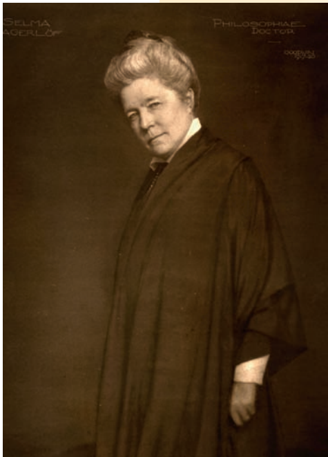
048sw Abb.: www.imagebank.sueden.se © Henry B. Goodwin / The Royal Library

Neben ihrer schriftstellerischen Tätigkeit engagierte sich die gelernte Lehrerin für Gerechtigkeit und Unterdrückte. So bot sie jüdischen Flüchtlingen Schutz und setzte sich für die Gleichbehandlung von Frauen ein. 1940 verstarb sie im Alter von 81 Jahren.