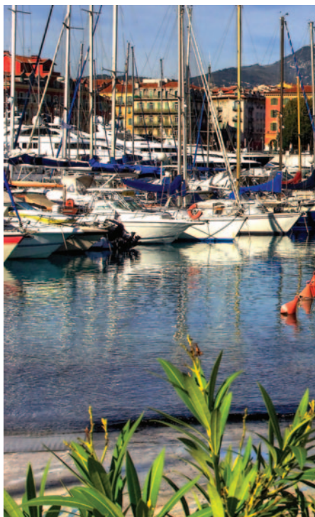
☒ Im alten Hafen von Nizza

Die Städte der Region tragen alle bekannte und wohlklingende Namen und sind doch so unterschiedlich: Avignons Stadtbild etwa ist geprägt vom Papstpalast aus dem 14. Jh., das schöne Aix-en-Provence gilt als die Lieblingsstadt der Franzosen und Marseille, die Hafen-Metropole, Frankreichs Brückenkopf nach Afrika, bildet mit all seinen Problemen und Chancen eine Art Kontrapunkt zur oft pittoresken Beschaulichkeit des Midi. Die Städte der Côte d'Azur schließlich reihen sich wie Perlen einer Kette dicht aneinander, wobei so mancher gleich ins Schwärmen gerät: der Blumenmarkt von Nizza, das Kasino von Monte Carlo, Jazz in Juan-les-Pins, der Strand von St-Tro-