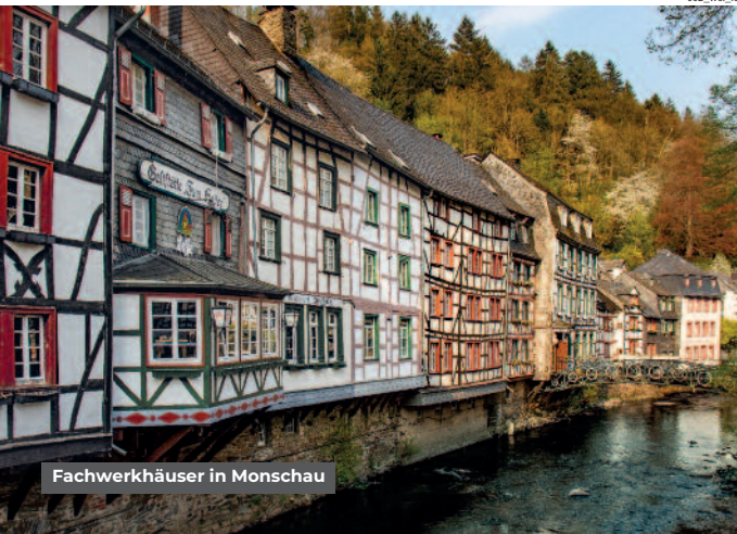
Fachwerkhäuser in Monschau