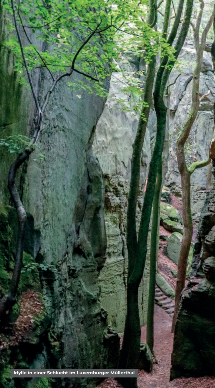
Idylle in einer Schlucht im Luxemburger Müllerthal