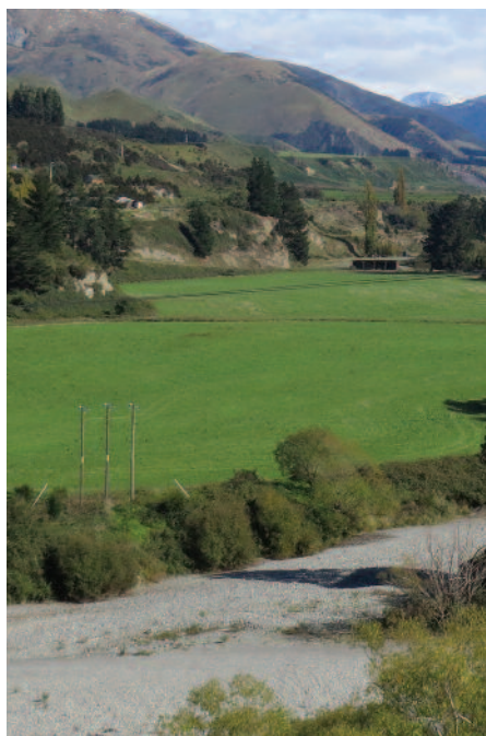
☒ Landschaft bei Hammer Springs in der Region Canterbury auf der Südinsel

Verständlich, dass das Land zu einem Paradies für Outdoor-Aktivitäten wurde: Wandern ist fast schon ein Muss, auch Radsport sowie unzählige Wasser- und Wintersportarten stehen Besuchern offen. Und spätestens, seit 1988 in der Südinselfestland Queenstown das kommerzielle Bungee-Jumping geboren wurde,