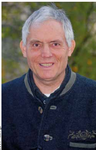
110v