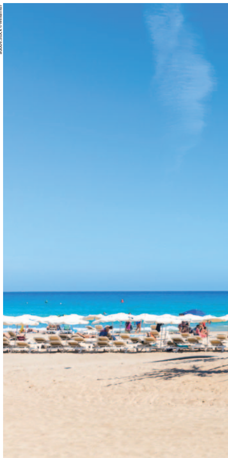
☒ Strand bei Alicante